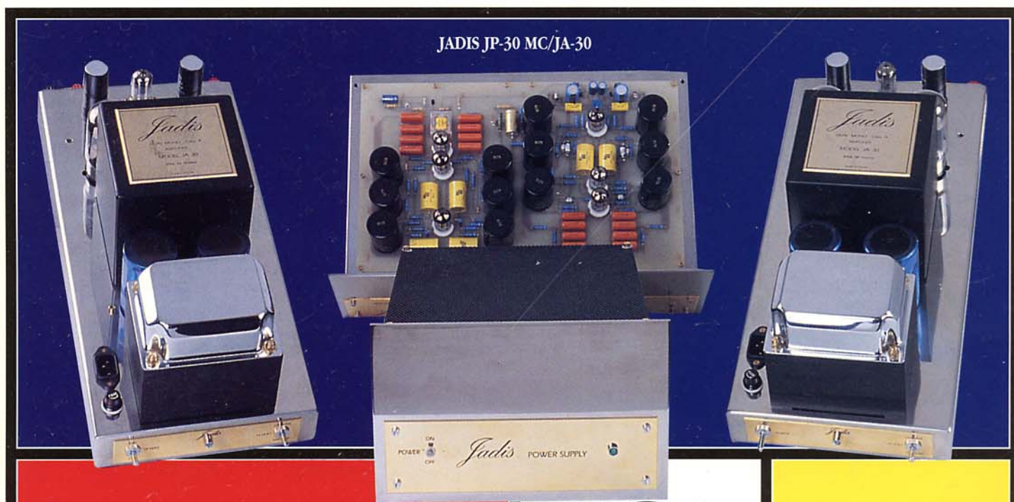
JADIS JP-30 MC/JA-30