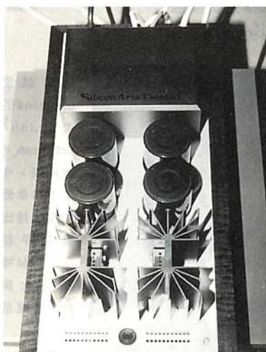
Silicon Art Design Indigo 90B 美金 8,000 元

Silicon Art Design 是日本的廠家，他們成立已有四年。這部後級作工有日本人一貫的水準，不過他讓我感興趣的倒是很少看到日本晶體機在 WCES 露面，所以特別找了設計者津田昌孝聊一下。我問他日本人不是特別喜歡真空管機嗎？怎麼他會鐘情於晶體機呢？透過翻譯，他告訴我日本人的確喜歡真空管機，尤其是老式的真空管機。不過，他認為他的晶體機一樣能夠發出很好的聲音，而且特性更穩定，所以才會設計晶體後級。Indigo 90B 每聲道輸出只有 80 瓦而已，而賣價卻要八千美金，我看恐怕相當難賣。