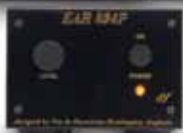
E.A.R. 834P Sig.