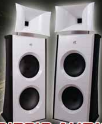
DIESIS AUDIO CAPUT MUNDI