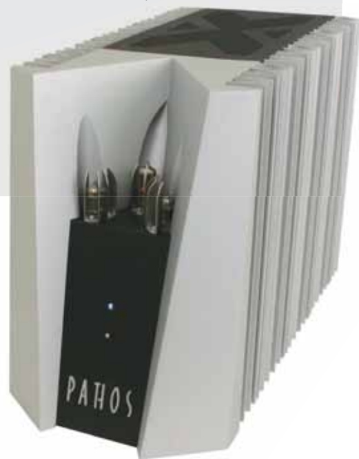
A sinistra il preamplificatore Synapse, a destra il finale mono Adrenalin.