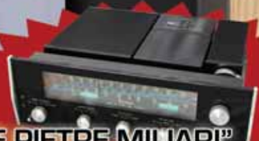
"LE PIETRE MILIARI" MCINTOSH MR74